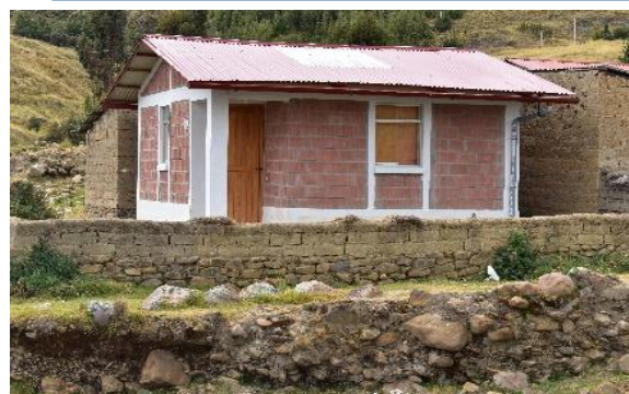
FOTO 06: Se aprecia asentadas viviendas mejoradas en la margen derecha del río Harque - Quiquijana - Quispicanchi.