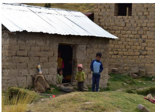
FOTO 05: Viviendas familiares habitadas próximo al río Harque, comunidad campesina de Hayuni - Quiquijana.