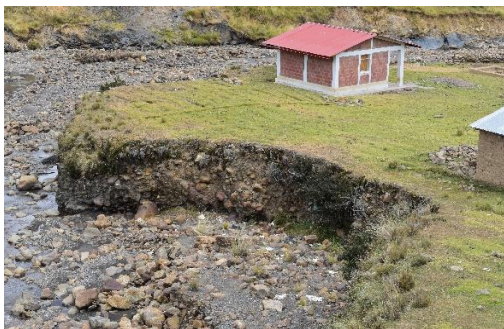
FOTO 01: Se aprecia el cauce del río HARQUE con flujo de agua temporal, actualmente sin infraestructura de defensa ribereña, forma mendrica y con cauce colmatado.