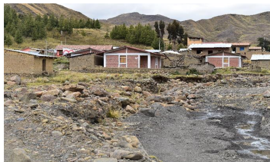
FOTO 02: Se aprecia asentada viviendas familiares Barrio Central, comunidad campesina de Hayuni - Quiquijana.