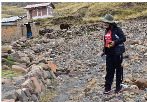
FOTO 03: Participación del representante de Jefe defensa Civil Quiquijana